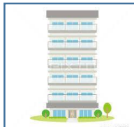
マンションの敷地内